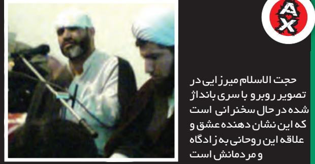
حجت الاسلام ربوبر و یا سوری پانداز تصویر ر ربوبر و یا سوری پانداز شده در حال سخنرانی است که این نشان دهنده عشق و علاقه این روحانی به ز ادگاه و مردمانش است